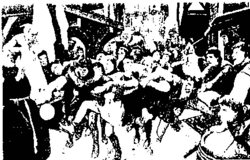
Den brutala folkfotbollen i England hade gatan som spelplan.

Samtidigt som idrotten, i detta konkreta fall folkfotbollen, fungerade som ett slags säkerhetsventil, blir den en spegling av samhället och de motsättningar som existerade mellan olika grupperingar.